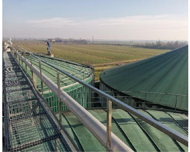
Figura 2. Planta Biogàs