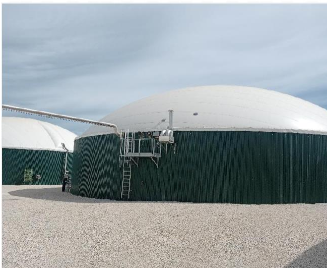
Figura 1. Planta Biogàs.

La transferència de la gallinassa a una planta de biogàs evita el seu emmagatzematge a l'aire lliure fins al seu ús agronòmic, reduint l'olor, les emissions de gasos d'efecte d'hivernacle (GEI) i també la petjada de carboni en termes de CO 2 eq per kg de carn produïda. La consciència dels impactes ambientals de la cria de pollastres i l'adopció de pràctiques agrícoles sostenibles són factors clau per mitigar l'impacte negatiu de les granges de pollastres d'engreix en el medi ambient.